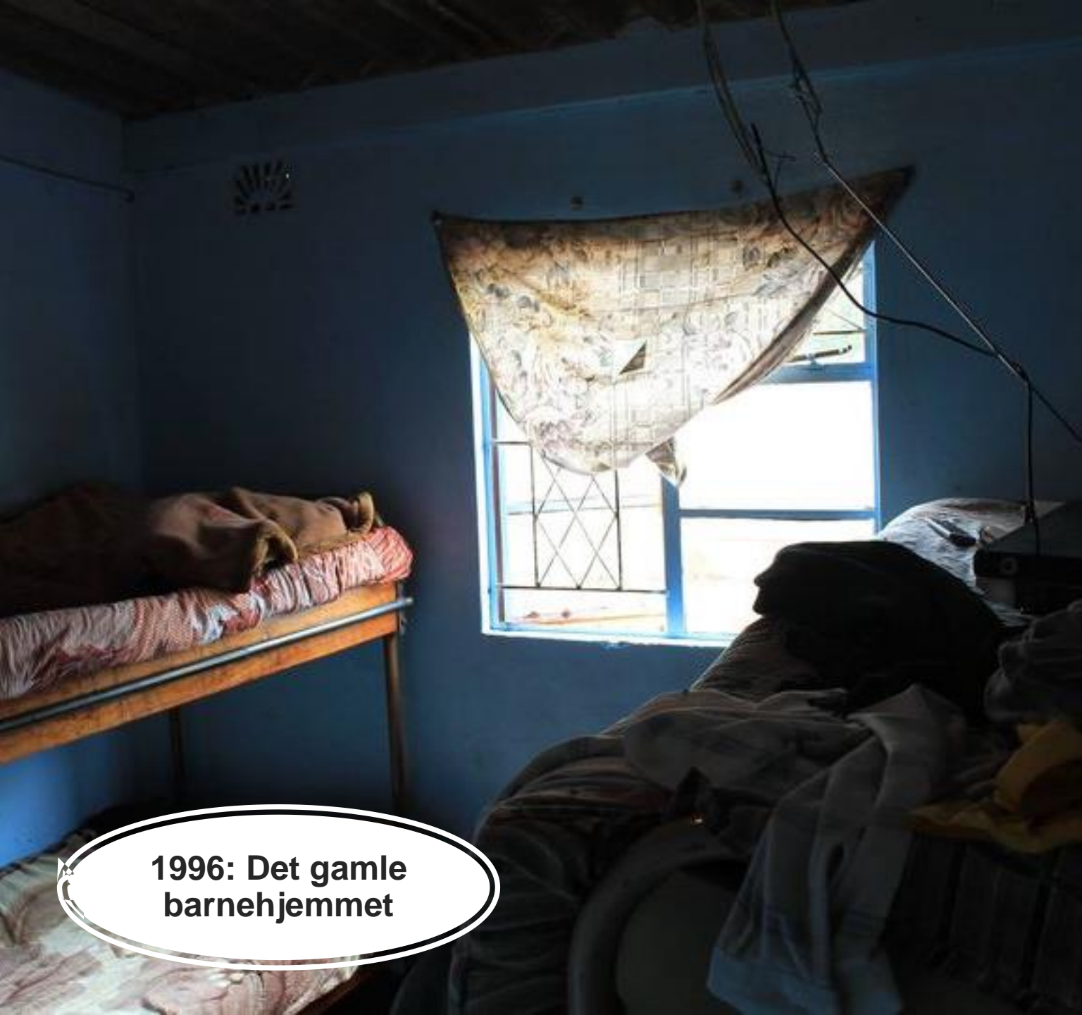
1996: Det gamle barnehjemmet