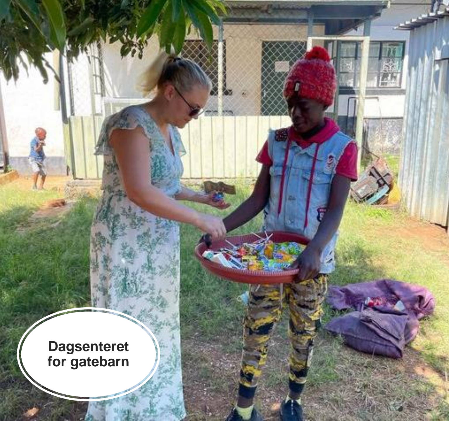
Dagsenteret for gatebarn